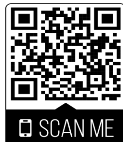
รายงานผลการประเมินและตรวจสอบ ๖๔